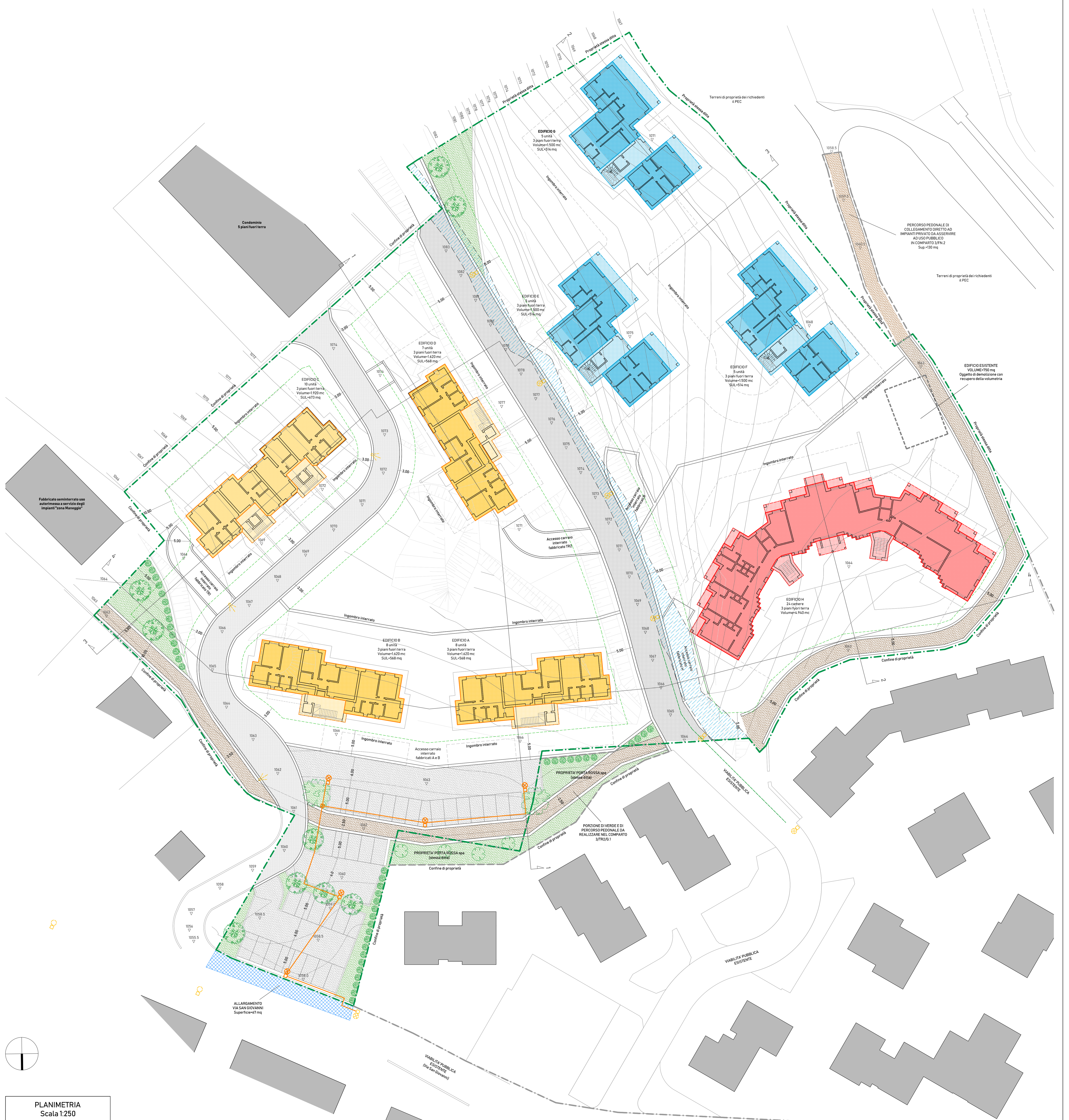
PLANIMETRIA Scala 1:250